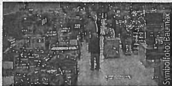
Baumax ist in Zwettl bald Geschichte.