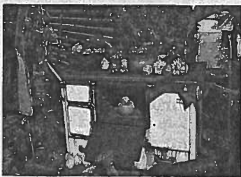
Bei der Baumschule Bauer ist man bestens für den Herbst gerüstet.

Die Baumschule ist bestens gerüstet mit großem Sortiment von Nutzpflanzen, damit der Gartenfreund bekannte und weniger bekannte Obstsorten wie etwa Ribisel, Himbeere, Apfelbeere oder Bayernkiwi erwerben kann. Die Pflanzenproduktion im nördlichen Waldviertel bereitet etwas mehr Schwierigkeiten, dafür sind die Pflanzen widerstandsfähiger und kimagewohnt. Auf fachliche Beratung wird in