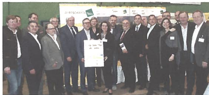
61 Unternehmen präsentierten sich und ihre Berufs-Chancen in Waidhofen.

Es wurde auch schon verraten, dass die nächste stattfindende Messe in der Mehrzweckhalle in Allentsteig abgehalten wird. WERBUNG