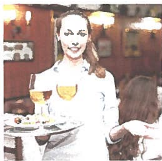
Gastro-Berufe bieten tolle Entwicklungschancen.